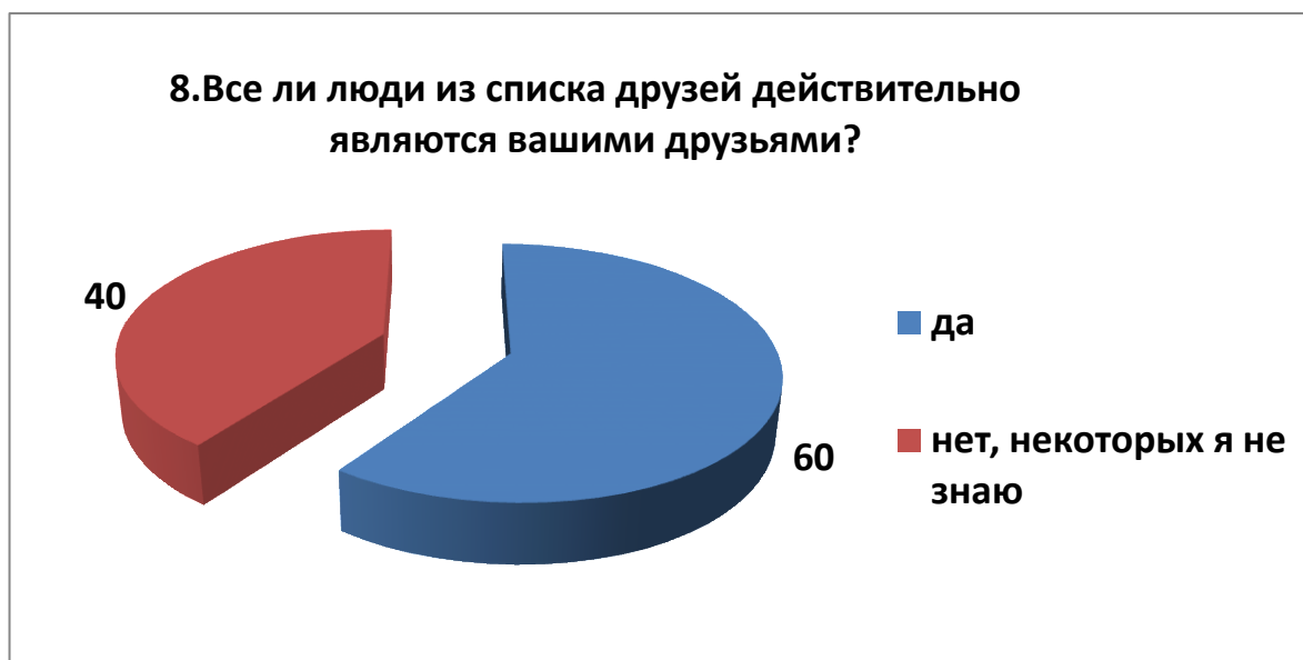
Рис.8. Вопрос 8.

Восьмой вопрос «Все ли люди из списка друзей действительно являются вашими друзьями?» прост в изложении ответов, но показывает нам, что 40% подростков не знают людей, которые у них добавлены в друзья (рисунок 8).