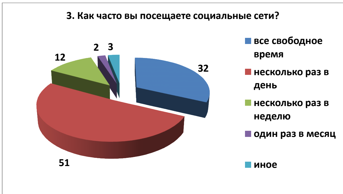
Рис.3. Вопрос 3.

Третий вопрос «Как часто вы посещаете социальные сети?» вскрыл следующую картину. 51% подростков посещают социальные сети, проверяя свои страницы по несколько раз в день. 32% опрошенных «сидят» в соцсетях все свободное время. 12 % подростков «заходят» в соцсети несколько раз в неделю, и лишь 2% ребят – один раз в месяц. Статистика свидетельствует о том, что в общей сложности 83% учащихся посвящают общению в социальных сетях почти все свое свободное время (рисунок 3).