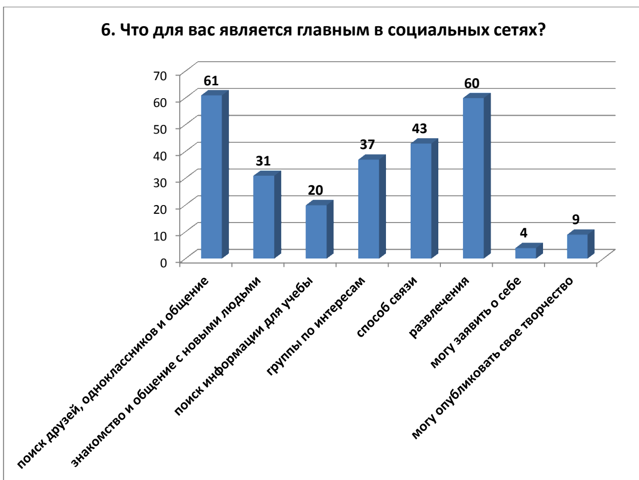
Рис.6. Вопрос 6.

Шестой вопрос «Что для вас является главным в социальных сетях?» определил мотивы посещения социальных сетей. На данный вопрос ребята могли дать не более трех вариантов ответов. Поиск друзей, одноклассников и общение с ними стали преимущественными (61%), почти рядом стоит выбор развлечений в социальных сетях (это игры, музыка, фильмы) - 60%, в 43% случаях для подростков социальные сети являются способом связи, еще 37% образуют группы по интересам, 31 % ставят для себя целью знакомство и общение с новыми людьми. Положительным моментом стал тот факт, что в 20% случаях ребята получают помощь в поиске информации для учебы в «ВКонтакте», 9% опрошенных публикуют свое творчество в сети (рисунок 6).