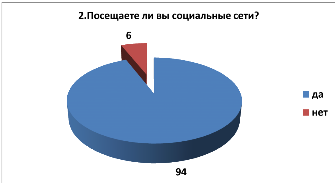
Рис.2. Вопрос 2.

Третий вопрос «Как часто вы посещаете социальные сети?» вскрыл следующую картину. 51% подростков посещают социальные сети, проверяя свои страницы по несколько раз в день. 32% опрошенных «сидят» в соцсетях все свободное время. 12 % подростков «заходят» в соцсети несколько раз в неделю, и лишь 2% ребят – один раз в месяц. Статистика свидетельствует о том, что в общей сложности 83% учащихся посвящают общению в социальных сетях почти все свое свободное время (рисунок 3).