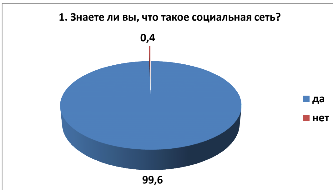
Рис. 1. Вопрос 1.

Первый вопрос «Знаете ли вы, что такое социальные сети?». Среди опрошенных учащихся 99,6 % знакомы с социальными сетями, остальные 0,4% подростков не знают, что такое социальные сети (рисунок 1).