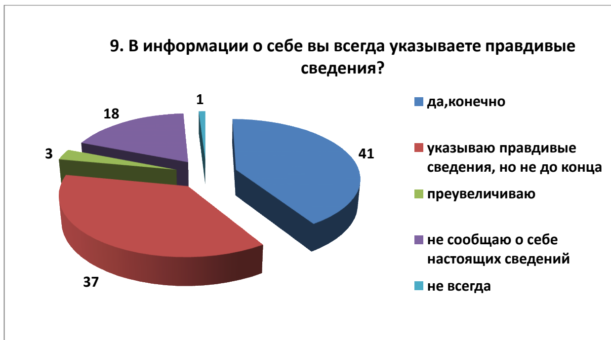
Рис.9. Вопрос 9.

И, наконец, на девятый вопрос «В информации о себе вы всегда указываете правдивые сведения?» 41% опрошенных ответили «да, конечно», что может быть использовано против ребенка. 37% подростков пишут о себе, но не до конца. 18% ребят не сообщают о себе настоящих сведений, 3% преувеличивают, а 1% ребят пишут о себе правду, но не всегда (рисунок 9).