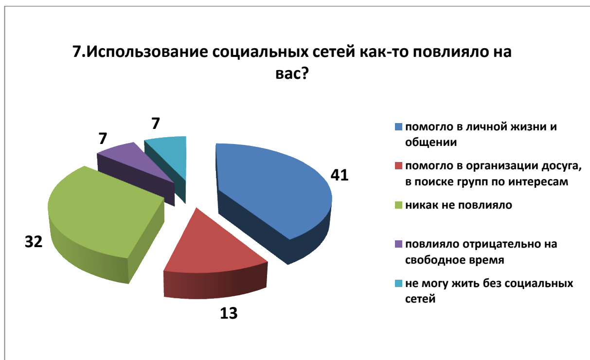
Рис.7. Вопрос 7.

отрицательно, отнимая у них свободное время. К сожалению, 7% подростков написали, что не могут жить без социальных сетей (рисунок 7).